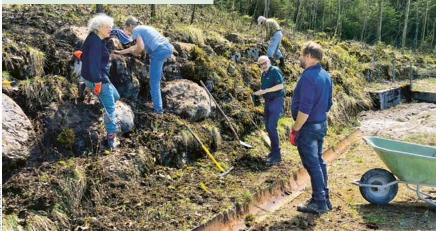
Diese überwucherte Mauer wird für die Zauneidechse freigelegt.

Weitere Informationen bei Kaspar Windlin, info@zimmerei-windlin.ch