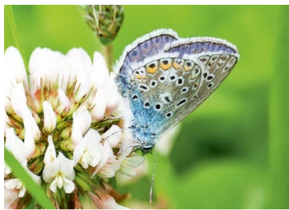
Ein Bläuling beim Nektartanken