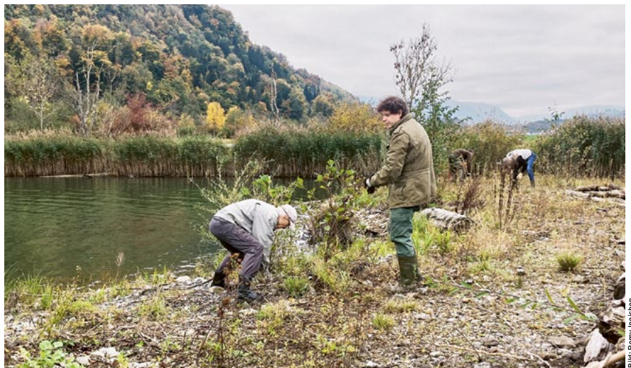
Das Entfernen von Neophyten beim Pflegeeinsatz im Städerried erforderte viel Kraftaufwand.