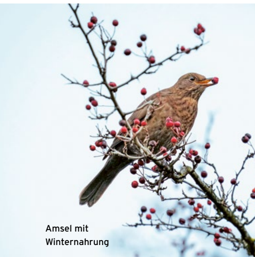
Amsel mit Winternahrung